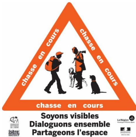
Panneau « chasse en cours »