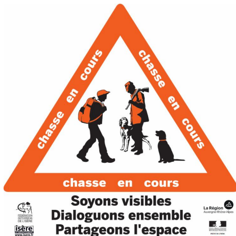
Panneau « chasse en cours »